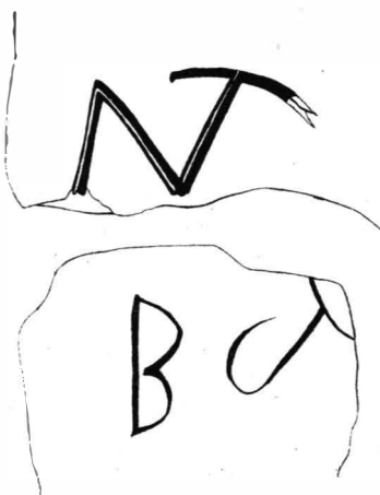
Fig. 2. — Litere pe cărămizi romane