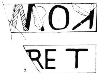
Fig. 3. — Două ștampile militare pe cărămizi romane

literele N și T , în ligatură (forma literei T este rară 7 ); pe alta BM . În amîndouă cazurile este vorba probabil de numele cărămidarului.