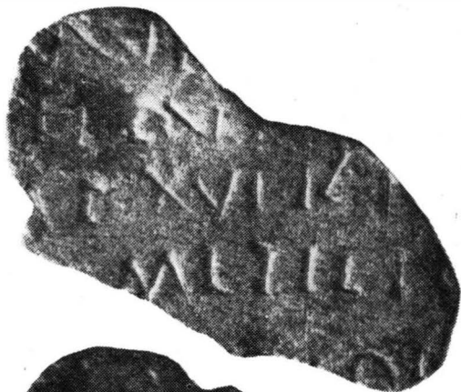
Fig. 5. — Fragment de diplomă militară găsit la Orlea (ilustraţii mărite).

Fragmentul de bronz are o lăţime de 2,9 cm, iar înălţimea de 2,3 cm. Este găurit în colţul stîng superior, prezentînd o uşoară concavitate; partea convexă păstrează doar cîteva litere.