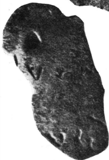
Tabella I extrinsecus :