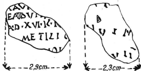
Fig. 4. — Fragment de diplomă militară găsit la Orlea (desen)

La 6 km V de Celei se află satul Orlea , una din cele mai de seamă așezări rurale romane din teritoriul Sucidavei 14 . În colecția muzeului sătesc de aici se află un mic fragment de diplomă militară, inedit, descoperit în raza comunei Orlea (fig. 4 și 5).