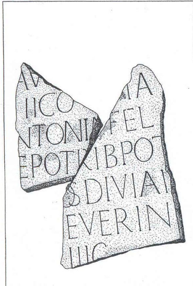
Fig. 2. Apulum. Fragment de inscripție cu dedicație pentru un împărat roman (desen reprodus după editorii inscripției).

Suntem de acord că fragmentele aparțin aceleiași inscripții, dar îmbinarea nu este corectă. Propunem următoarea lectură: