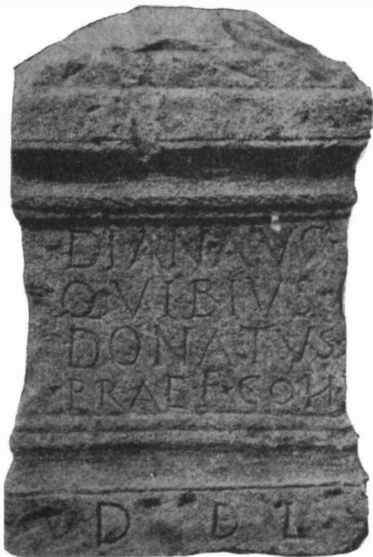
Fig. 1. — Ara din calcar, descoperită la Pojejena de Sus.

2. Galicea Mare (r. Băilești, reg. Oltenia). Ara din calcar nisipos descoperită cu prilejul lucrărilor agricole din 1959. Se păstrează la Muzeul regional al Olteniei din