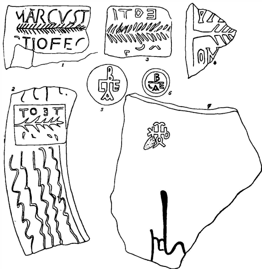
Fig. 3. — 1, fragment din buza unei mortaria din lut, stampilată, descoperită la Stolniceni; 2—4, fragmente de stampile aplicate pe mortaria , descoperite la Sucidava (Celei); 5—7, stampile cruciforme găsite pe fragmente din gîturi de amfore, la Sucidava.

Avem în față al 153-lea document privitor la sclavii din Dacia 1 . Dedicăția se face de către Dioscorus sclavul unui Ianuaris , împreună cu o soție sclavă ( contubernalis ), al cărei nume l-a radiat soțul mai târziu, probabil în urma des-