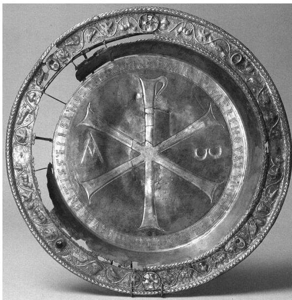
Fig. 1. Discul lui Paternus (fotografie). După D. Velina Koleva, Zeugnisse der Kunst und Kultur der Protobulgaren aus der heidnischen Periode des Ersten Bulgarischen Reiches (7.–9. Jh.) . Wesen. Ursprung. Parallelen, Berlin, 2007, p. 233, Ab. 95.