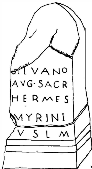
Fig. 2. — Inscriptie latină de la Roșia Montană (Alburnus Maior)

Din exemplele oferite de inscripțiile italiice nu se poate bănui originea africană a indivizilor purtători ai unui astfel de cognomen. În schimb cognomenul feminin Afra , din două inscripții italiice, ne lasă să întrevădem posibilitatea unei asemenea origini 6 . Pe de altă parte însă exemplele oferite de inscripții dovedesc tocmai contrariul. Astfel T. Aur. Africanus eq(ues) sing(ularis), ex tur(ma) Germani, nat(ione) Raetus 7 , sau C. Iulius C. f. Arn. Africanus Brixello optio equit(um) coh(ortis) IX pr. 8 , ne arată în mod cît se poate de limpede originea cu totul alta de cum ar părea să indice cognomenul. Tot origine italică, și deci deosebită de cea indicată numai prin cognomen, o are și L. Veratius C. f. Qui. Afer, Foro Iuli, veteranus, decurio, quaestor Anti 9 . Două inscripții din Palencia (Hispania) sînt dedicate divinității iberice Duillis 10 de către Annius Atreus Caerri Africani f(ilius) 11 . Dintr-o localitate din Syria se cunoaște altarul dedicat lui Iupiter Heliopolitanus de către un oarecare Africanus 12 . Din Gallia provine altarul închinat divinității celtice Icauna 13 de către T. Tetricius Africanus 14 . De altfel se poate afirma că anumite cognomina care derivă din numele unei anumite populații, sau după o provincie ori regiune, în realitate nu