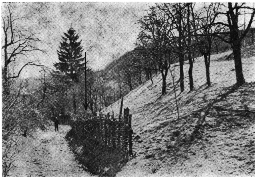
Fig. 1. — Racovița — jud. Sibiu. Locul descoperirii.