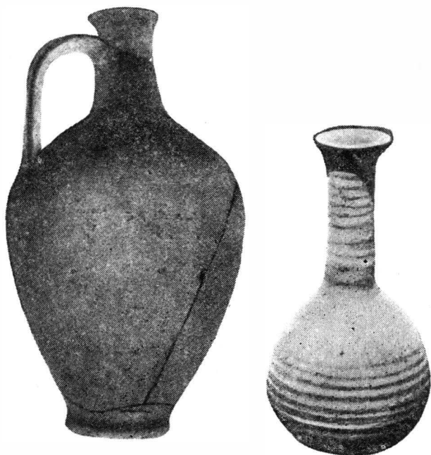
Fig. 3. Urcior și unguentarium din inventarul mormintului.

Tipul zeiței Venus, astfel cum se conturează din stilul figurii, se