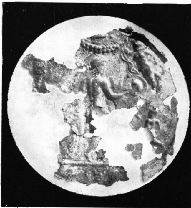
Fig. 2. Resturile membranei de bronz aurit care acopera spatele oginzii de bronz.