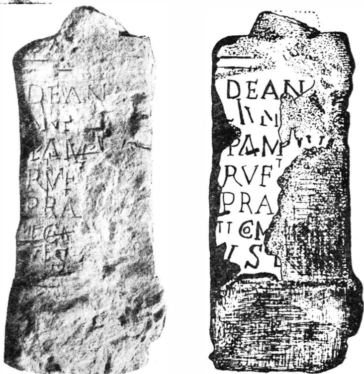
Fig. 2. Micia. Altar dedicat Diane și Lunii.

Ținînd cont de raportul dintre mărimea literelor și spațiul rămas disponibil în fiecare rînd, propunem întregirea următoare, pe care o vom motiva în cea de-a doua parte a articolului :