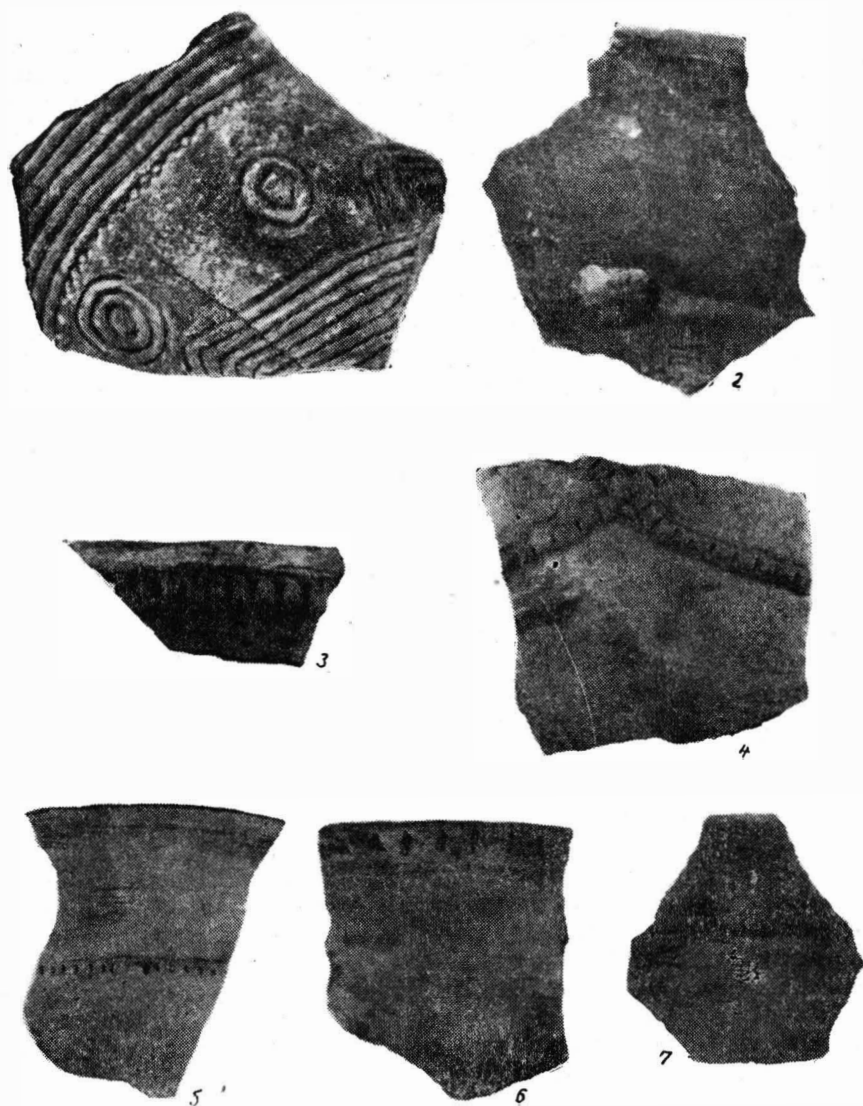
Fig. 3. — 1, fragment de vase de la Sf. Gheorghe-Piatra de Veghe; 2—7, fragmente de vase de la Zăbala.

În valea Oltului, unde cultura Schneckenberg domină la începutul epocii bronzului, mai este atestată și o cultură nouă, cultura Ciomortan, denumită astfel după locul descoperirii, cunoscută din așezările de la Cio-