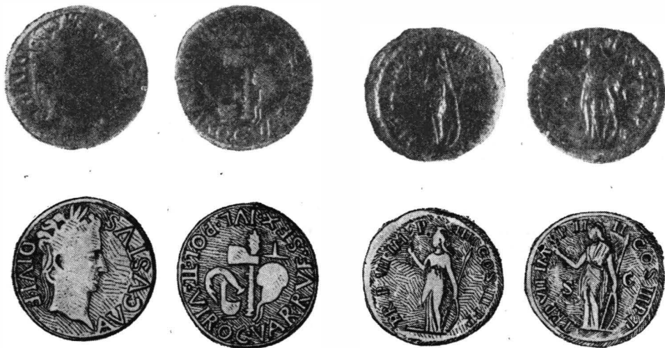
Fig. 1. — Monedă de bronz emisă de mone-tăria Ilici din timpul lui Augustus.

As. 10,04 g; 27 mm. Moneda este bine conservată; are o frumoasă patină verzuie.