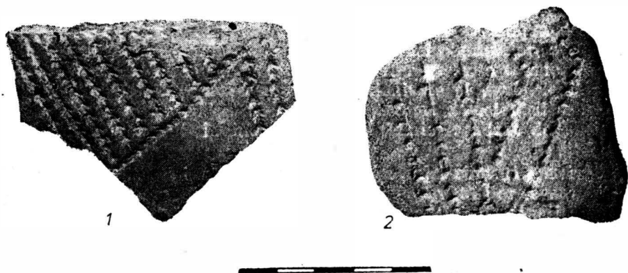
Fig. 1. 1—2 Rast.

Al doilea fragment (cel de pe pl. XLIX/14 — din volum; aici fig. 1/2 și 2/2), aproape de aceleași dimensiuni ca și primul, a fost descoperit pe