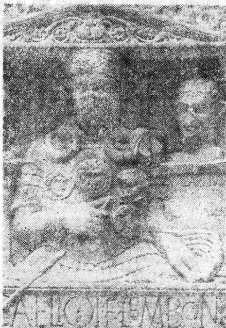
Fig. 3. Stelă funerară cu reprezentări ale lui Eros descoperită la Histria.