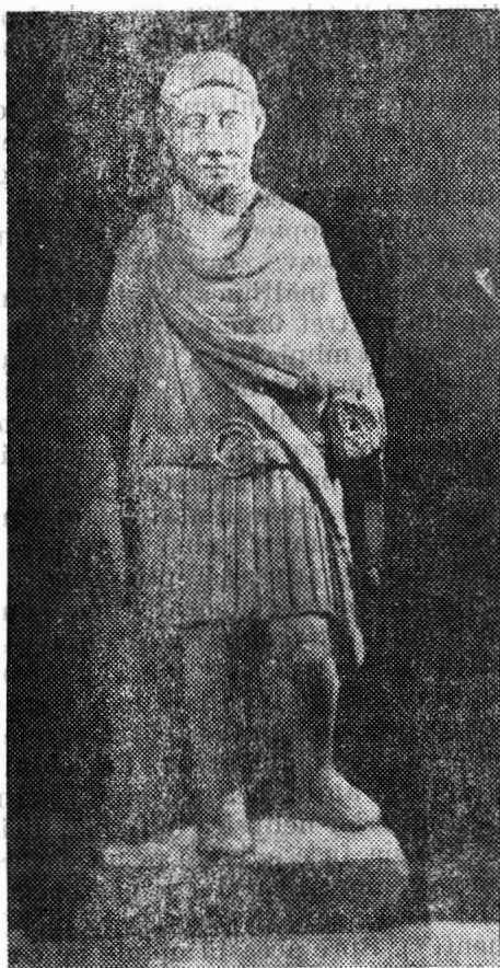
Fig. 1. Statui-portret descoperite la Apulum.

Capul, despiins la descoperire, înfățișează un portret masculin cu privirea ridicată în sus, avînd ochii prevăzuți cu pupilă mobilă. Masa capilară, redată sumar, este sugerată prin ușoare cioplituri de daltă.