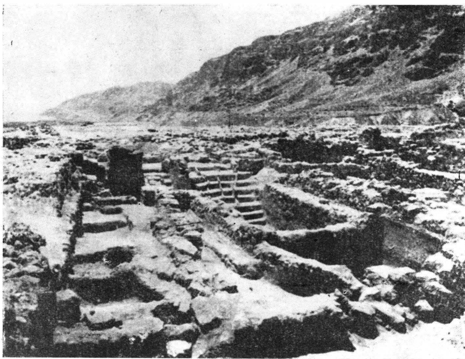
Fig. 2. — Ruinele edificiilor comunității religioase de la Khirbet-Qumrân.

Mormintele sînt indicate la suprafața solului prin pietre ovale; sub ele, la o adîncime de 1,30 m — 2 m se află scheletele orientate S—N (capul fiind la S). Există o mică deviație a