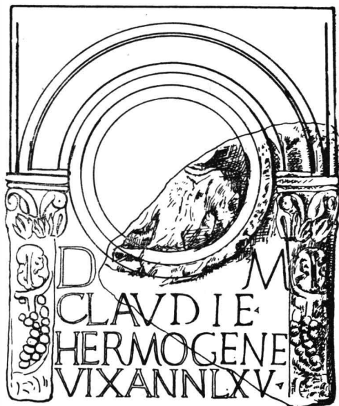
Fig. 1. Apulum. Steła funerară a Claudiei Hermogena (CIL, III, 7 808) : a fotografia fragmentului (Muzeul județean Deva) ; b reconstituirea grafică.

[D(is)] M(anibus) [Cla]udi(a)e [Her]mo[gen(a)]e [vix(it) an. ?LX] V(?)