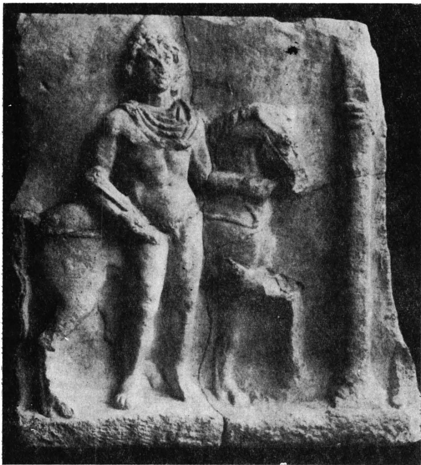
Fig. 1. — Relief descoperit la Valea Săcă (în apropiere de Constanța), reprezentînd un Dioscur.

intenția meșterului de a imita coloanele corintice de epocă romană 5 . Este de așteptat deci, ca al doilea cîmp să fi fost încadrat într-o ediculă, dar partea de deasupra capitelului este avariata, așa că aici bănuim doar, începutul arhitravei sau, poate, o acroteră.