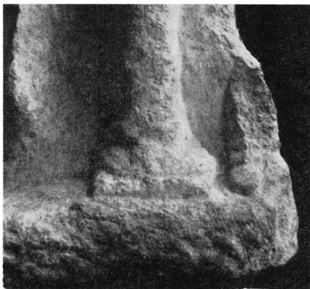
Fig. 4. — Fragmentul păstrat din cel de al doilea cîmp al reliefului de la Valea Seacă.

din jurul gîtului (care coboară rotund pe piept) ale hlamidei ce atîrna în spate, încheiată pe umărul drept. Fața rotundă este în bună măsură avariată. Ochii mari sînt tratați plastic (fig. 2). De sub bonetă, părul buclat cade, de o parte și de alta a feței, pînă spre umeri, rotunjindu-se în spate, pe lîngă gîtul plin. Detaliile anatomice ale trupului, deși evi-