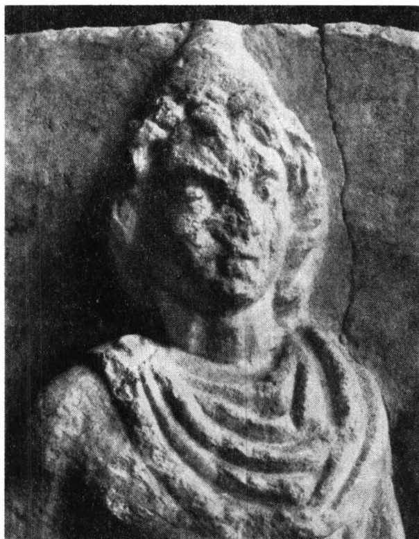
Fig. 2. — Relieful de la Valca Seacă — detaliu: capul Dioscurului.