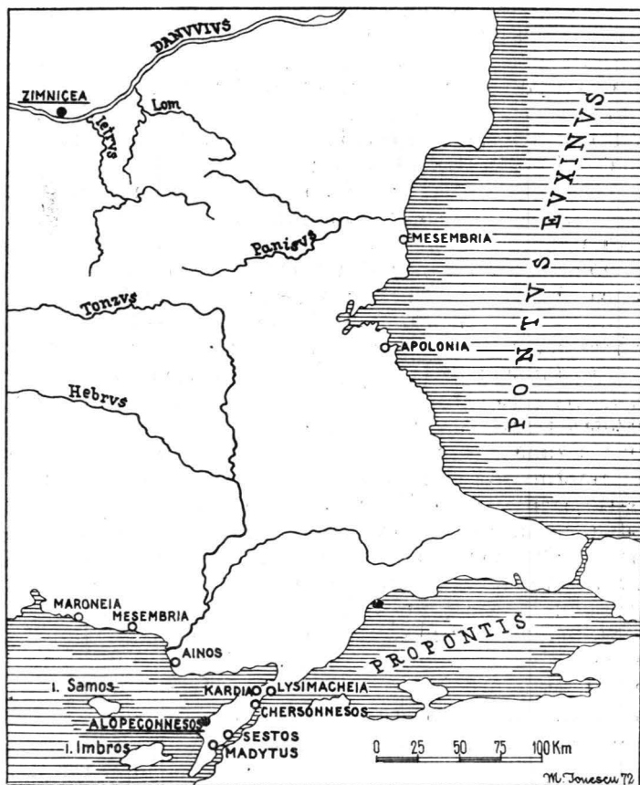
Fig. 2. — Orașul emitent și locul de găsimă al monedei.

Oricum ar fi, din datele de care dispunem pînă acum rezultă limpede că orașul Alopeconnesos era un port la Marea Egee, servind ca punct de tranzit și ca adăpost pentru pirați. El se găsea într-o cîmpie situată între golful Sarov și apa Geri, în fața orașului Cardia. Din aceleași știri