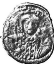
Fig. 4. Monede din tezaurul de la Păcuil lui Soare.