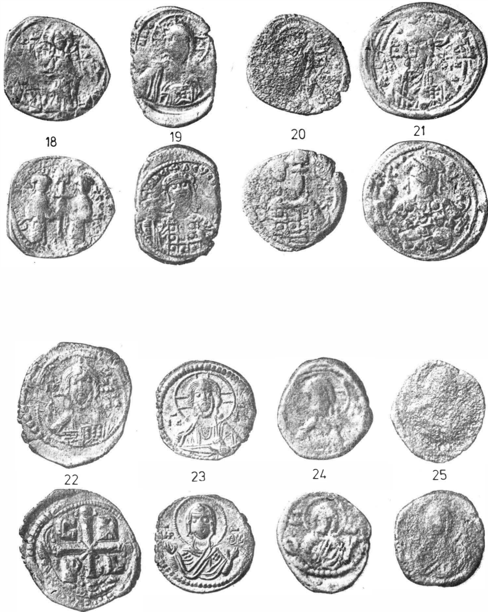
Fig. 3. Monede din tezaurul de la Păcuil lui Soare.