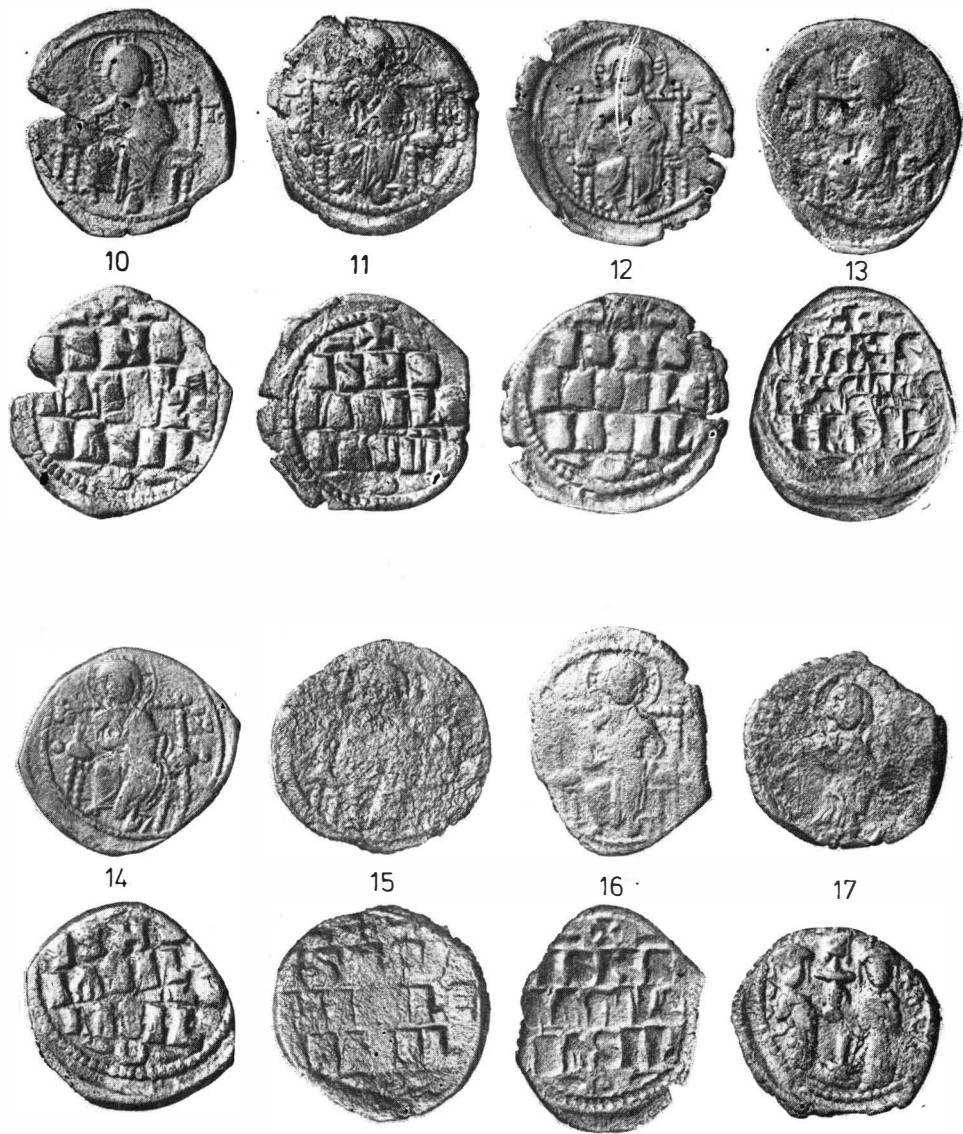
Fig. 2. Monede din tezaurul de la Păciul lui Soare.