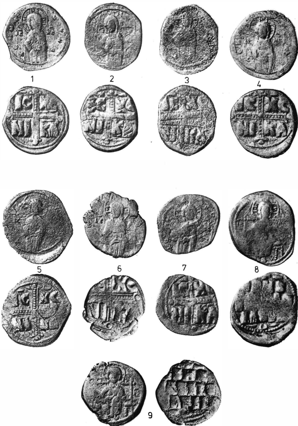
Fig. 1. Monede din tezaurul de la Păcuiul lui Soare.