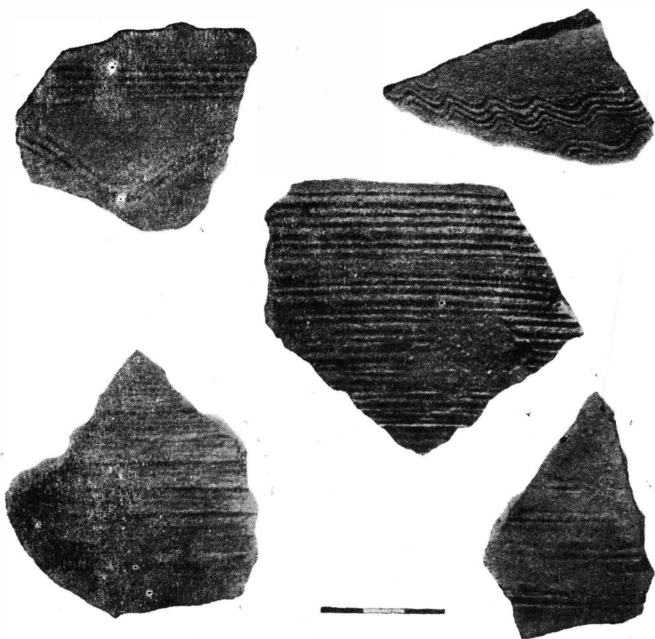
Fig. 2. — Radovanu. Fragmente ceramice, descoperite împreună cu uneltele și armele.

Ostroh. Alte exemplare similare, dar puțin deosebite, se găsesc și în R. P. Bulgaria la Jakimovo 5 .