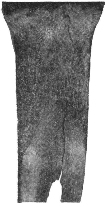
Fig. 4. — Detaliu.

Cu toate că uneori se poate potrivi curbura vaselor cu a șlefuitoarelor, nu se poate susține că acestea au servit la lustruitul ceramicii, căci șlefuitoare au apărut și în medii în care fie că nu se cunoștea ceramica, fie că nu se cunoștea cea lustruită. Mai trebuie ținut seama și de faptul că la unele șlefuitoare se observă fie pe fața șlefuită fie pe marginea ei sau în afară, mici striuri paralele și perpendiculare, care nu se pot datora decît obiectelor ce se șlefuiiau și care erau desigur dintr-un material dur (fig. 4); este deci puțin probabil să fi fost făcute de os pe os și cu atît mai puțin de ceramică. Striurile se pot datora și nisipului care ajută la șlefuire. Amintim ca piese asemănătoare, dar care cu greu pot servi la interpretarea șlefuitoarelor neolitice, unele oase descoperite în așezări feudale din șesul ungar, folosite și mai tîrziu de țesătorii din regiune 3 .