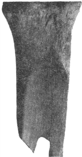
Fig. 3. — Detaliu.

La prelucrarea cărei categorii de obiecte au servit șlefuitoarele, nu se poate preciza. J. Banner, care a publicat pentru prima dată asemenea unelte, descoperite în așezări ale culturii Tisa, le socotește ca fiind întrebuințate la ascuțirea uneltelor de os, de la care ar proveni și striurile de pe fețele șlefuite 5 . J. Neustupný, pornind de la studiul a 52 exemplare din Cehoslovacia — lustrate din metatarsiene, mai rar metacarpene și excepțional o tibie de bou — ajunge la aceeași concluzie cu Banner, adăugînd că puteau servi și la alte obiecte făcute din materii organice moi, de pildă din lemn 6 , amintind și faptul că șlefuirea se făcea întîi pe piatră și numai finisajul pe os 7 . S. A. Semenov crede că șlefuitoarele se întrebuințau la netezirea și lustruirea ceramicii, albierea lor potrivitându-se cu curbura unor vase 8 .