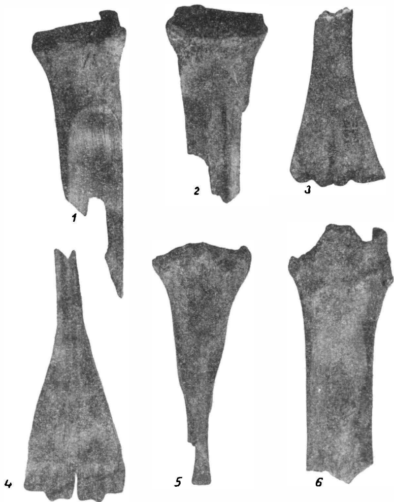
Fig. 2. — Șlefuitoare fragmentare de la Larga.

dreptul căror uneori striurile se încrucișează. Suprafața șlefuită nu este deci perfect netedă, șlefuirea nefăcându-se permanent pe toată suprafața, ci uneori numai pe mici porțiuni. De aceea și după rupere șlefuitorul mai era folosit,