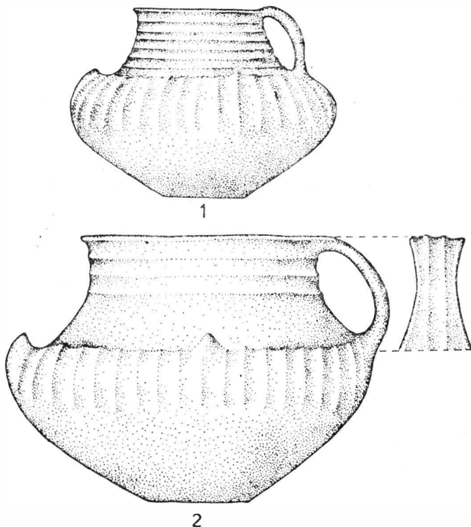
Fig. 1. Vase cu o toartă. 1 Tiszakeszi (după T. Kemenczei), 2 Curtuiușeni.

Analogia aproape perfectă a acestui vas provine dintr-un mormînt descoperit în nord-estul Ungariei, la Tiszakeszi („Szódadomb”) și publicat recent de T. Kemenczei. Singura deosebire față de vasul de la Curtuiușeni