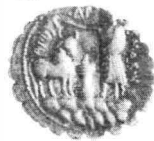
Fig. 2. — Monedele din tezaurul de la Zătreani.