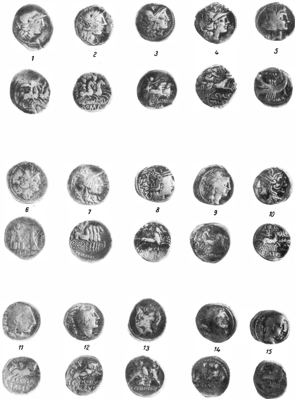
Fig. 4 — Monedele din tezaurul de la Hotărani.