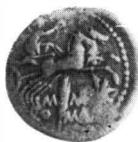
Fig. 3. -- Monedele din tezaurul de la Zătrene.