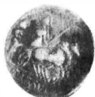
Fig. 5. — Monedele din tezaurul de la Ișotărani.