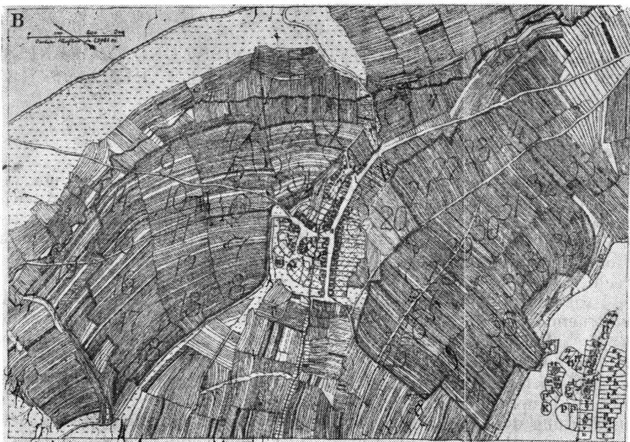
Fig. 2. Planul hotarului și al așezării Daia/Sibiu (după August Meitzen, Die Flur Thalheim als Beispiel der Ortsanlage und Feldeinteilung im Siebenbürger Sachsenlande , in AVSL, XXVII, 1897, p. 694 bis).

anul 1300 23 , nu putea exista ca o entitate adversară voievozilor români tocmai în reședința de scaun a acestora. Privilegiile acordate coloniștilor din Moldova și Țara Românească atestă că aici colonizarea a fost apreciată de autoritățile locale ca un act economic pozitiv. Aici, dincoace de Carpați, apar și mai evidente preocupările neagricole ale coloniștilor germani, pentru că ei sînt prezenți în Țara Românească la Cîmpulung, Curtea de Argeș,