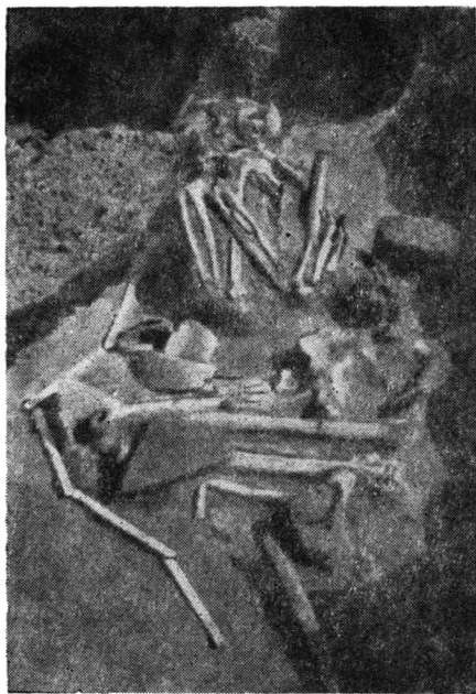
Fig. 1. — Mormîntul de la Săcueni.

pe anumite porțiuni, rețele. Pe alocuri, mai ales într-una din zone, parte din linii par a fi șterse anume, încă din vechime, atunci când se realiza decorul vasului, cu intenția de a se face nu o rețea, ci divizarea pe verticală a zonei cu decor pictat în vederea obținerii a două suprafețe ală-