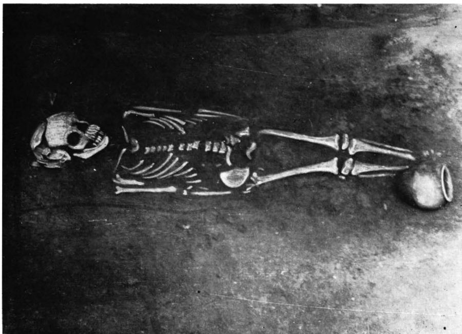
Fig. 1. Scheletul din M 2 de la Chirnogi.