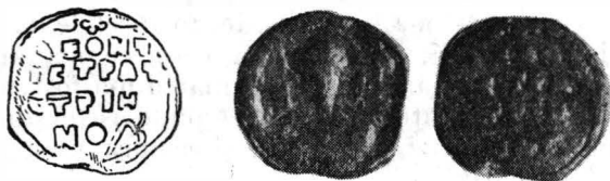
Fig. 5. — Leon, strateg istrian.

Av. Bustul nimbat al Sf. Teodor Stratilat, patronul oraşului Silistra, reprezentat din faţă şi ţinînd sprijinită pe umărul drept o lance uşor înclinată spre stînga. De o parte şi de alta inscripţie în coloană, ştearsă aproape în întregime : [‘Ο ἄγιος Θεόδωρος)].