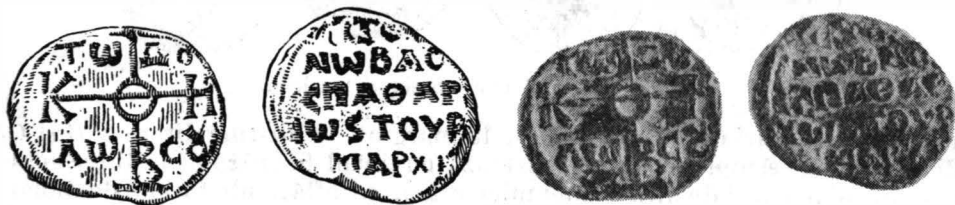
Fig. 2. — Aetolios, spătar imperial și turmarh.