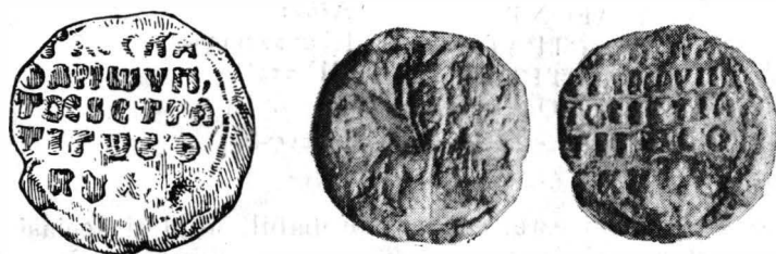
Fig. 6. — Ioan, spătar, consul și strateg al Bulgariei.

Av. Sf. Ioan Prodromul, bust, din față, purtînd mantie simplă și ținînd în dreapta o cruce, puțin înclinată spre dreapta. De o parte și de