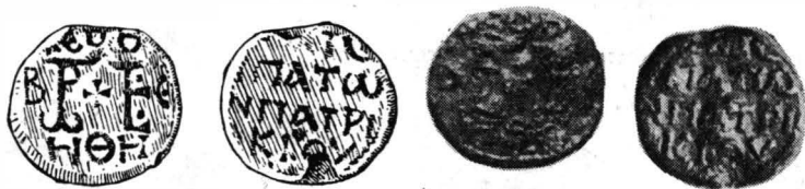
Fig. 4. — Sigiliul unui consul și patriciu.

Av. Sus, în r. 1, se mai păstrează parte din trei litere, care, cu ajutorul literelor HΘH, care se citesc în ultimul rînd, alcătuiesc cel mai probabil cunoscuta formulă [+ KĒ BO] HΘH = K(ύρι)ε βο(ύ)θ(ει). Între