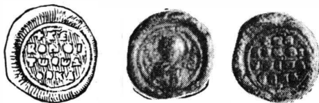
Fig. 7. — Sigiliul lui Phocas.