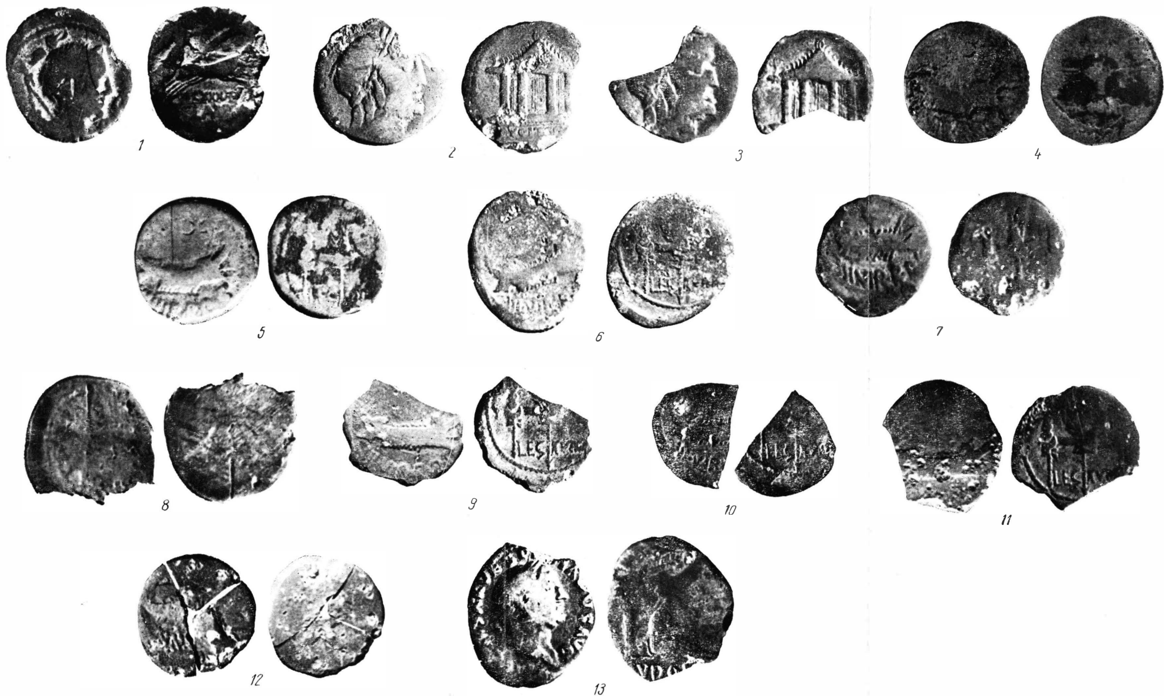
Fig. 2. — Monedele din tezaurul de la Bozieni (r. Roman) (mărite de două ori).