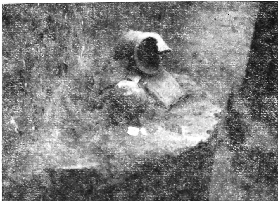
Fig. 3. — Oinac (Giurgiu); mormînt de incinerație (nr. 81) aparținînd complexului Sintana-Cerneahov.

3. Oasele depuse atît în urnă cît și pe fundul gropii (M. 71).