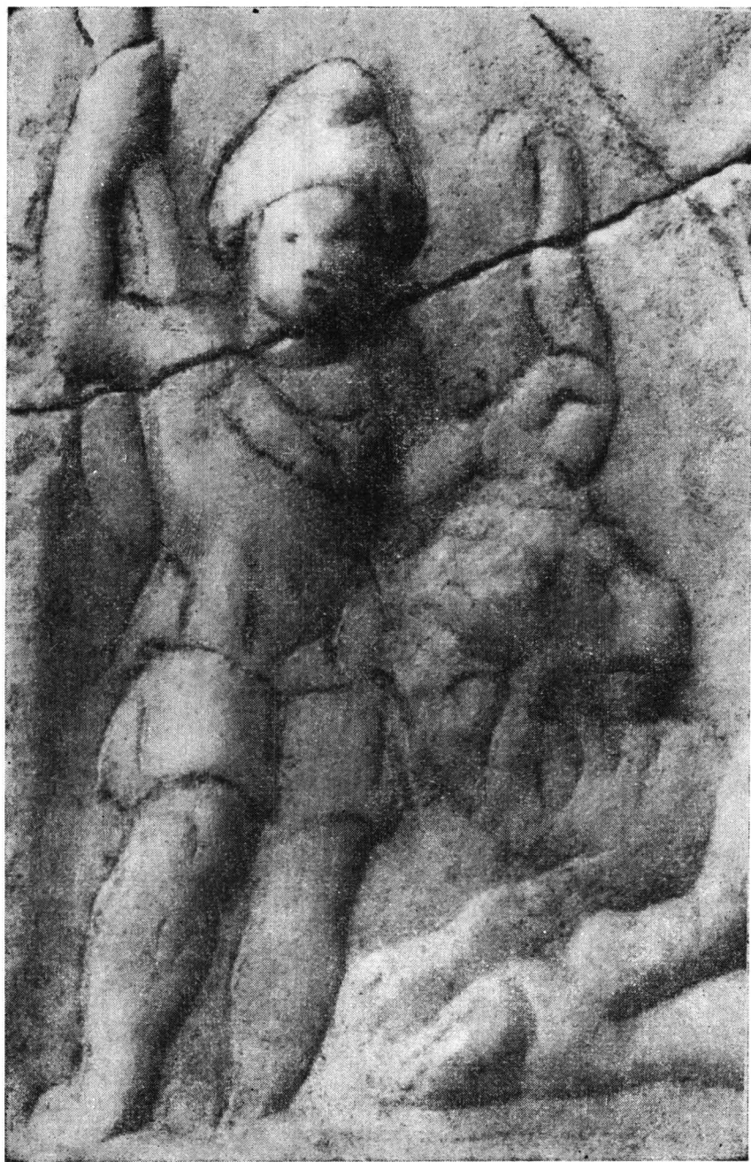
Fig. 3. — Detaliu din relieful fără inscripție.