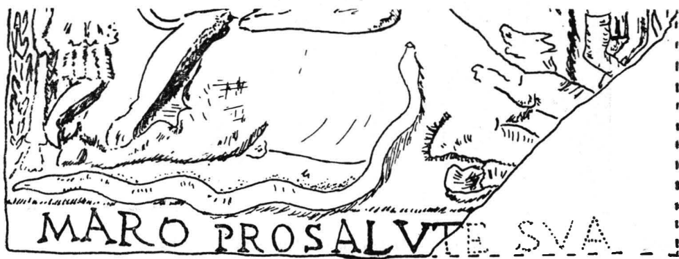
Fig. 5. — Partea inferioară a reliefului cu inscripție (Încercare de reconstituire).