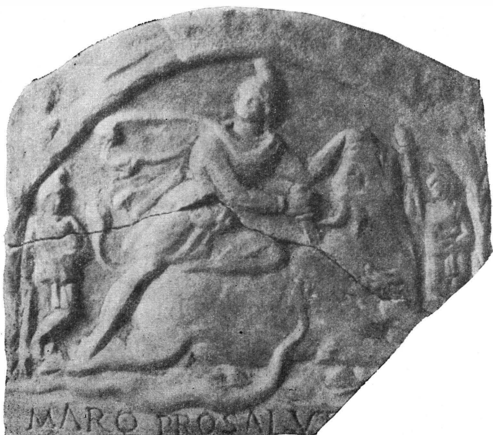
Fig. 4. — Relief mithriac cu inscripție.