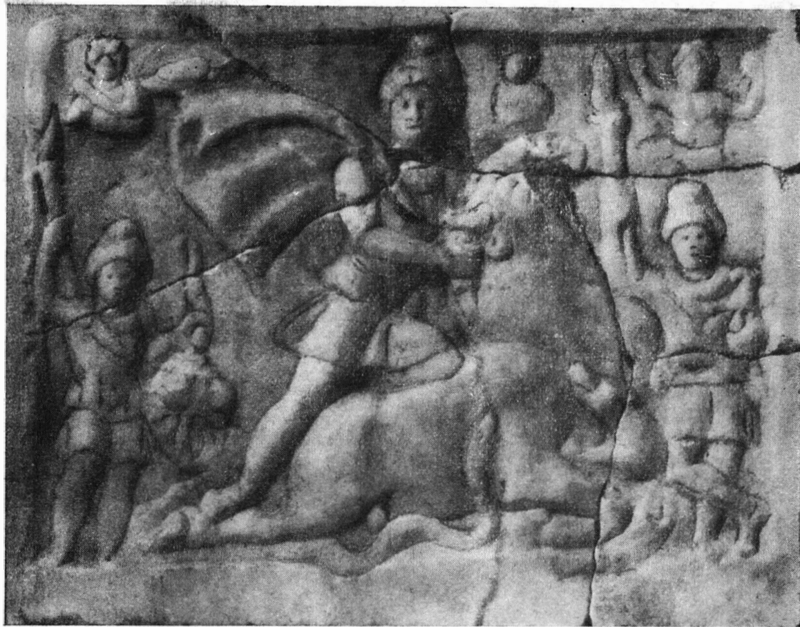
Fig. 2. — Relief mithriac fără inscripție, descoperit la Ulpia Traiana-Sarmizegetusa.