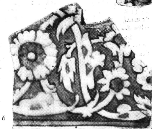
Fig. 3. — Iași. Plăci de faianță otomană de Iznik, de la Curtea domnească; secolul al XVII-lea (dimensiuni aproximative : 1 = 1/4 ; 2-6 = 1/2).