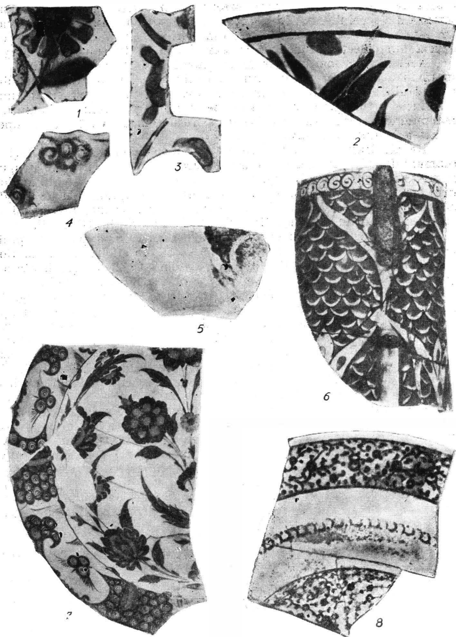
Fig. 1. — Iași. Faianță tare, otomană, de Iznik. 4, 5, 7, 8, de la Curtea domnească ; 1-3, 6, de la biserica Sf. Sava ; a doua jumătate a secolului al XVI-lea (dimensiuni aproximative : 1,2 = 1/1 ; 3 = 1/3 ; 4,8 = 1/2 ; 5 = 2/3 ; 6 = 1/2 ; 7 = 1/3).