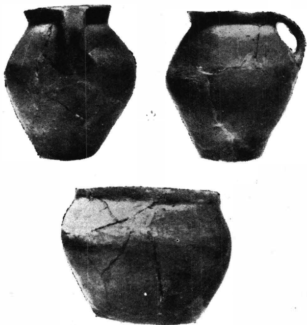
Fig. 3. — Moșna. Ceramică din stratul aparținând secolelor III-II î.e.n., corespunzător perioadei ulterioare celei în care se datează construirea cetății de pământ traco-getice.

circa 1 m. Partea superioară a valului cetății de la Moșna constă dintr-o depunere alcătuită din numeroase resturi de locuire (îndeosebi complexe in situ de chirpic ars, fragmente ceramice etc.), groasă de 0,20—0,60 m, care nu are nici o legătură organică cu partea inferioară a acestuia. Accentuăm că resturile de locuire abundă în regiunea valului, cu precădere spre creasta acestuia; ele diminuează brusc, devenind tot mai sporadice