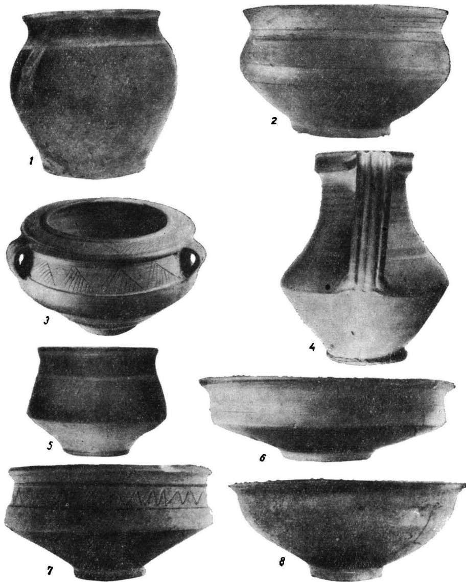
Fig. 1. — Vase lucrate la roată.

întinsă pe spate a scheletului și orientarea N (capul) — S (picioarele). Inventarul mormîntului cuprindea un castron din pastă fină (fig. 1/7) lângă femurul stîng și un resort de la o fibulă de bronz provenită din zona