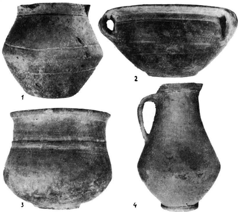
Fig. 2. — 1, vas lucrat cu mina; 2-4, vase lucrate la roată (1-3, descoperite în mormintul 1; 4, în mormintul 2).