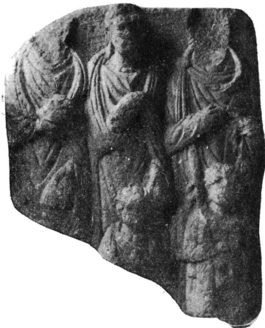
Fig. 4. — Stelă familială (Muzeul din Aiud).

4. Stelă familială (fig. 4), din piatră calcaroasă, a cărei proveniență este incertă (probabil din împrejurimile Aiudului) 7 . Se află în Muzeul din Aiud 8 . Are înălțimea de 155 cm, lățimea de 90 cm și grosimea de 11 cm. Se păstrează fragmentar, partea inferioară precum și colțul din stînga sus fiind rupte. Spatele monumentului nu este prelucrat.