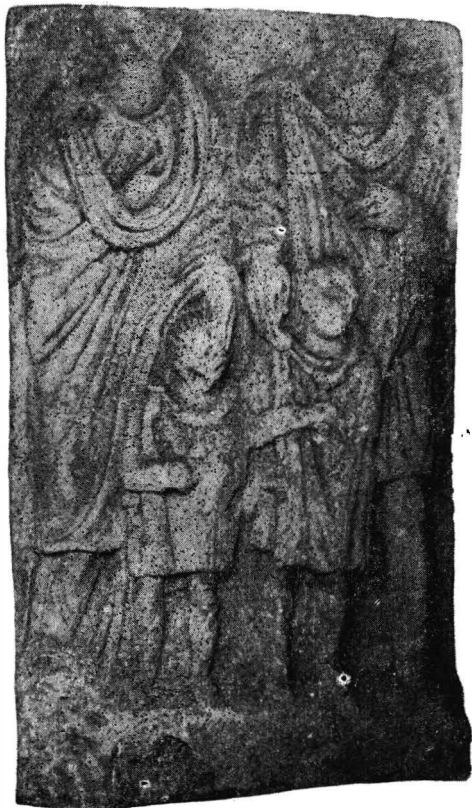
Fig. 3. — Stelă familială de la Gherla.

Execuţia acestei stele familiale vădeşte o concepţie artistică superioară, detaliile fiind cu grijă reliefate de către meşterul lapicid.