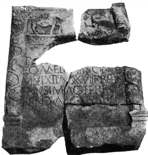
Fig. 2. — Gherla . Stela funerară ridicată de Brisenus .