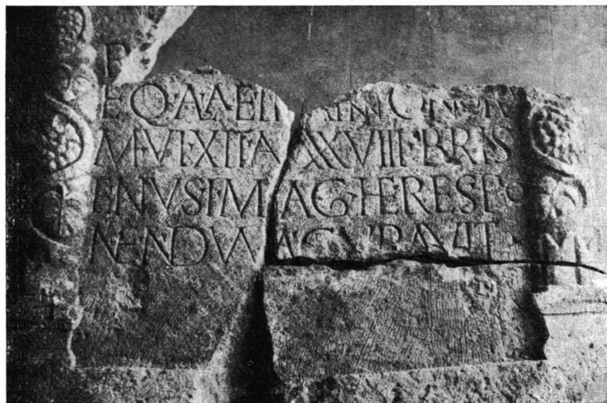
Fig. 3. — Gherla . Epitaful (fragmentar) de pe stela funerară ridicată de Brisenus .