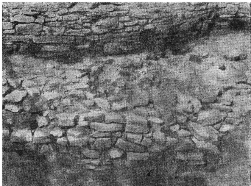
Fig. 2. Suceava — Cetatea de scaun. Zona de refacere a platformei.