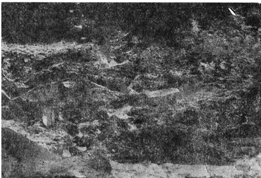
Fig. 4. Suceava — Cetatea de scaun. Resturile carbonizate ale porții prăbușite lingă pilonul de nord.