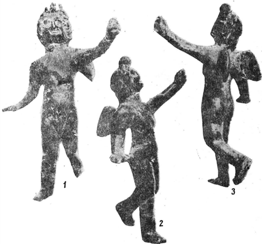
Fig. 3. Cioroiul Nou. Geniu.]