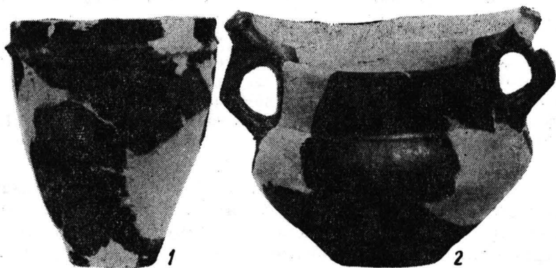
Fig. 2. Șopteriu-Finațe, com. Urmeniș. Inventarul recuperat al mormintului (foto).

perată oferă suficiente indicii pentru încadrarea cronologică și tipologică a mormintului. Vasele întregite aparțin prin formă, decor și tehnică de lucru ceramicii caracteristice culturii Noua, atestate pe teritoriul țării noastre