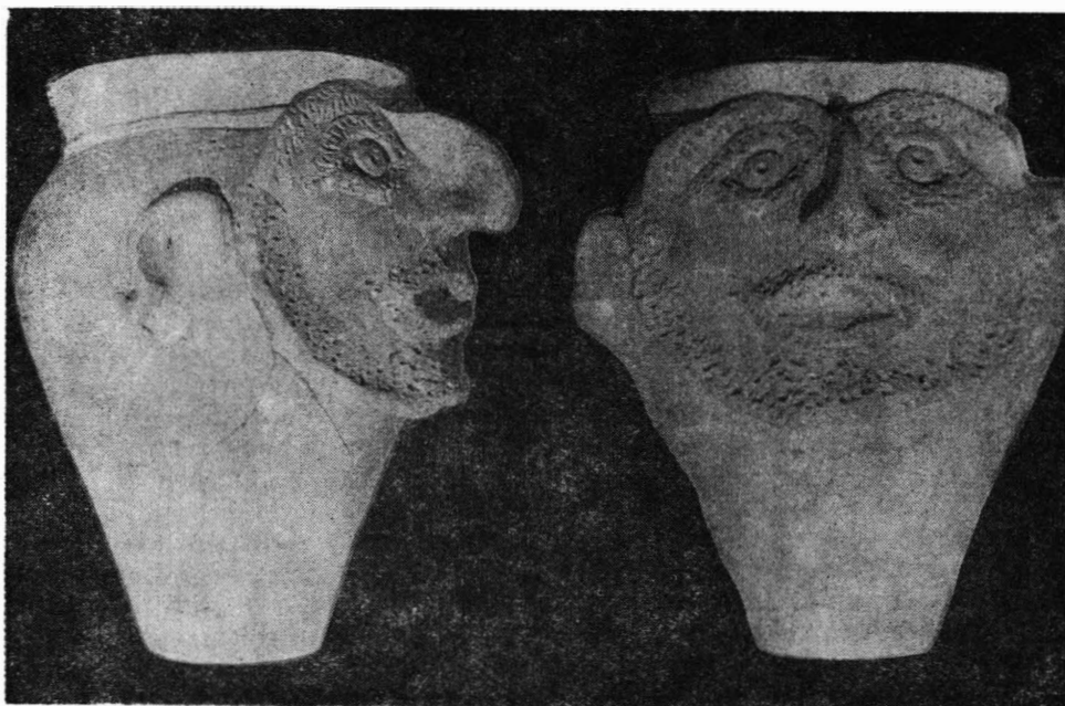
Fig. 1. Vas roman cu chip de om (restaurat) din teritoriul municipiului Durostorum.