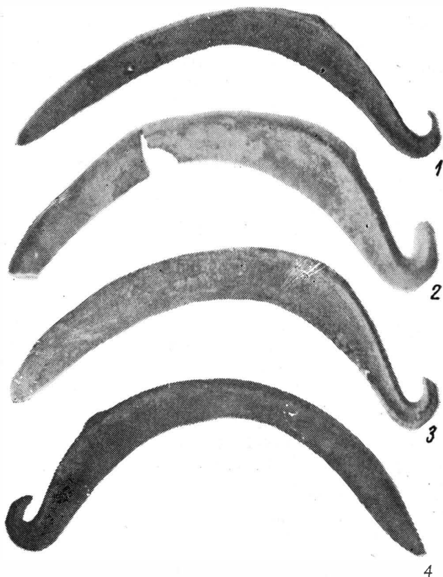
Fig. 2. Banca-Ghermănești. Depozit de seceri de bronz (foto).