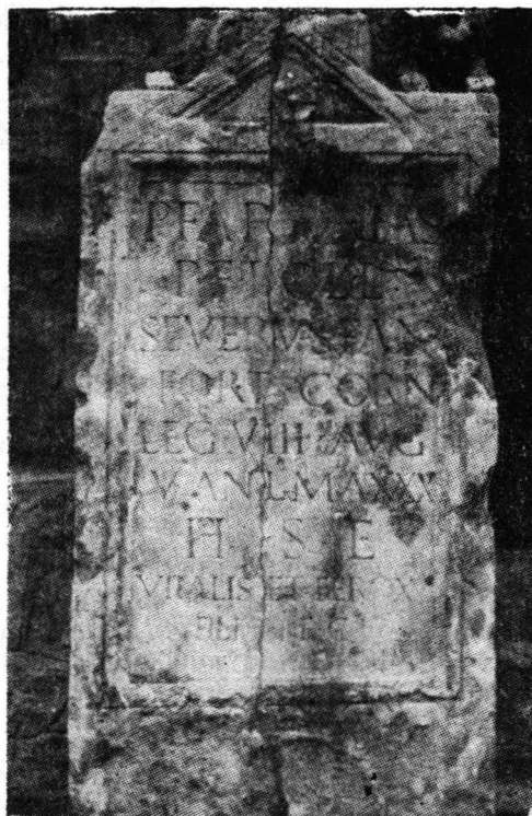
Fig. 4. Stela lui Publius Farfinias de la Novae.