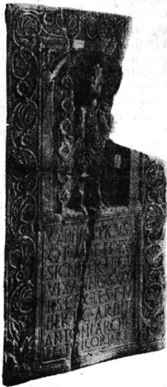
Fig. 9. Stela lui Quintus Philippicus.

Am lăsat anume la urmă stela lui Quintus Philippicus (fig. 9) publicată pentru prima oară de Gr. Tocilescu cu mențiunea că ar fi fost descoperită la Sucidava 32 . Este republicată apoi de Gr. Florescu, nr. 23, fig. 15, și datată la începutul secolului al II-lea. Datarea acestei stela a născut însă controverse. H. van de Weerd 33 și A. Alföldi 34 au datat această stelă în secolul al III-lea, epocă în care legiunea V Macedonica, al cărui signifer era Quintus Philippicus, se afla în Dacia. Ritterling 35 și G. Forni 36 sînt însă de părere că stela nu este mai tîrzie de epoca lui Claudius și a fost adusă de peste Dunăre, de la Oescus, garnizoană a legiunii V Macedonica pînă în vremea războaielor dacice cu o scurtă întrerupere între anii 62 și 71 e.n. O altă ipoteză este