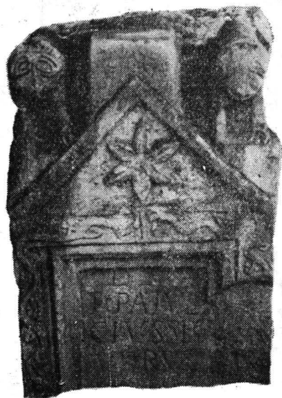
Fig. 5. Stela lui Ti. Patulcius Severus de la Rusănești.

Cele patru stele ale acestei grupe au fost descoperite de-a lungul Oltului, două dintre ele chiar la Romula, iar celelalte două la Rusănești.