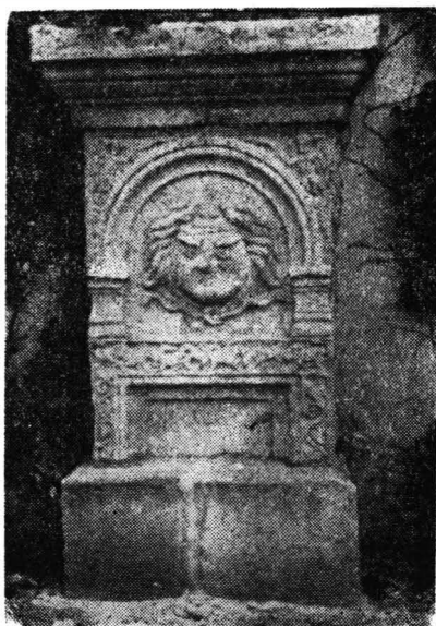
Fig. 8. Stela lui Aurelius Gratus.