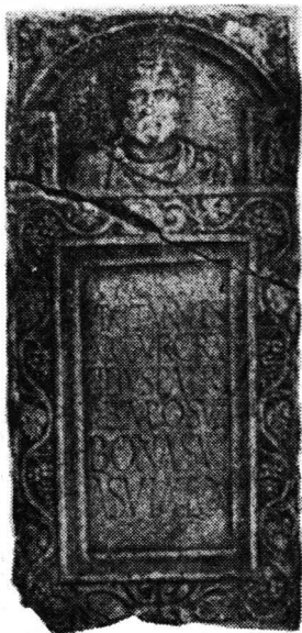
Fig. 7. Stelă de la Cioroiu Nou.