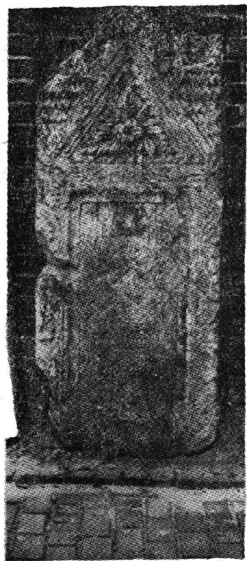
Fig. 6. Stela lui Aelius Valerianus de la Romula.