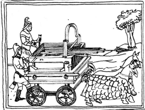
EXEMPLVM BALIS TE QVADRIOTIS.

La Drobeta s-a surprins construcția unor turnuri intermediare între porți și colțurile cetății, special amenajate pentru amplasarea mașinilor de război 49 . La Sucidava, turnurile semicirculare exterioare zidului, folosite pînă către ultimul sfert al secolului al IV-lea par să fi fost destinate amplasării artileriei 50 . Nu e exclus ca și la Drobeta și la Sucidava artileria să fi fost amplasată și la alte turnuri cu platforme special amenajate. Dafne nu trebuie să fi făcut excepție. Dacă admitem că ballistarii de la Dafne au staționat aici ca trupă limitanee , statică, atunci mașina de război specifică fortăreței era ballista fulminalis , de felul celei descrise de Anonymus de Rebus bellicis din a doua jumătate a secolului al IV-lea 51 , destinată exclusiv utilizării ei de pe platforma de artilerie din fortăreață (fig. 1). După descriere, acest tip de ballista era mult mai mare decît ballistele de fortăreață din secolul al II-lea care apar pe columna lui Traian (scenele 165 și 166) și evident decît cheiromballista sau manuballista lui Heron 52 . Tipul lui Anonymus se apropie foarte mult de cel înfățișat de Ammianus 53 . În secolul al IV-lea pare să fi existat o categorie specială