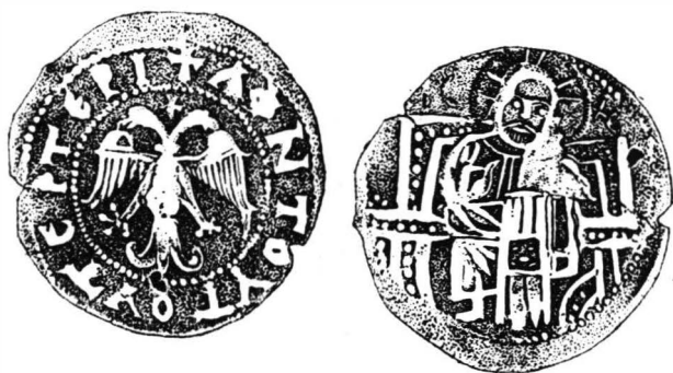
Fig. 2. Monedă de argint cu numele lui Terter.

În identificarea lor, N. Mušmov s-a întemeiat pe descifrarea monogramei \Upsilon\epsilon . După opinia acestuia monograma reproduce numele de Terter 12 . Nu încapă îndoială că lectura propusă de N. Mušmov este cât se poate de corectă. Faptul e certificat de o monedă de argint (fig. 2) descoperită la Păcuiul lui Soare 13 avînd pe avers un vultur bicefal — aidoma aceloră de