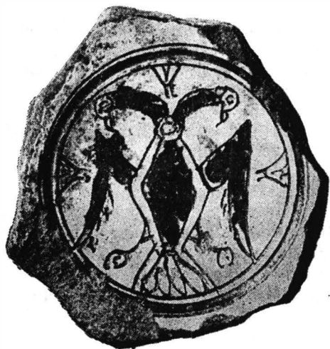
Fig. 4. Reprezentarea vulturului bicefal pe fundul unui vas de la Păcuiul lui Soare.

Străchinile de la Păcuiul lui Soare 47 nu-și găsesc — cel puțin pînă în momentul de față — nici o replică pe teritoriul țării noastre 48 ; în schimb, ele se reîntînesc la Chersones 49 , ceea ce nu trebuie să ne surprindă, dacă se are în vedere că în Crimeea secolelor XIII-XIV a ființat un despotat condus de feudali înrudiți cu dinastiile imperiale de la Trapezunt și Constantinopol 50 .