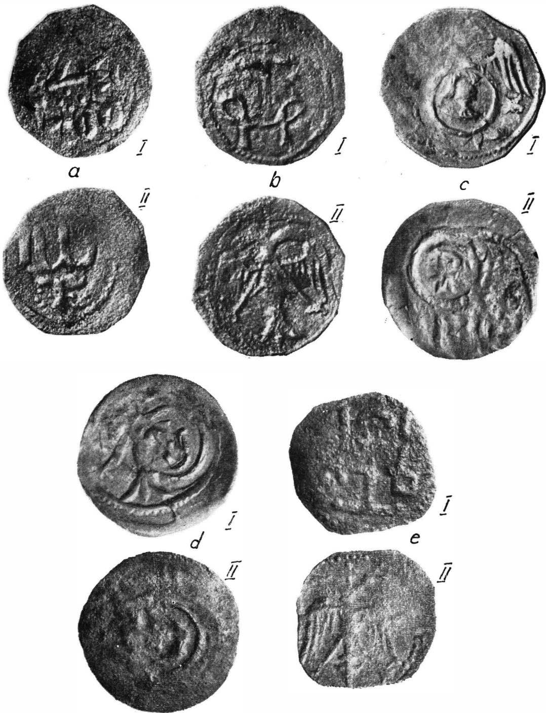
Fig. 1. a monedă purtind legenda \delta\epsilon\sigma\pi\acute{o}\tau\eta\varsigma ; b monedă cu monograma lui Terter; c-c monede cu contramarcă.