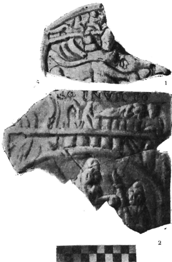
Fig. 1. Pojejena. 1 Placă votivă, fragmentul nr. 1; 2 placă votivă, fragmentul nr. 2 cu inscripția DEO INVICTO .

2. Placă votivă din marmură albă; fragment alcătuit din cinci fragmente lipite în laboratorul Muzeului de istorie a Transilvaniei. Reprezintă partea superioară a piesei. Lățimea totată a piesei a fost 20,2 cm; lungi-