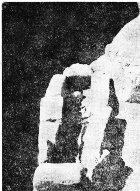
Fig. 2. Gura Canliei. Mormint de epocă medievală (foto).

În legătură cu tipul funerar amintit, M. Mirtshev considera că forma mormintelor de la Cavarna, construite din pietre de diferite grosimi, cioplite neregulat, constituie o tradiție a mormintelor paleocreștine de la sfârșitul secolului al IV-lea, obicei care s-ar fi păstrat până în secolul al XIV-lea 8 . Îndoirea brațelor și așezarea lor pe abdomen ar reprezenta un obicei funerar practicat încă din secolul al VI-lea e.n., până astăzi. Autorul consideră de asemenea că tehnica bună de execuție a mormintelor și alte elemente ale ritualului sau inventarului funerar reprezintă dovezi ale unei tradiții antice neîntrerupte și că necropola de la Cavarna aparține unei populații locale, creștine, din secolele amintite 9 .