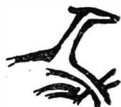
Fig. 2. Marcă de olar de la Dinogetia-Garvăn.

C-ei drept, asemenea cai se întilnesc, săpați în pastă crudă, și pe fundul unor căldări de lut din secolele al XI-lea — al XII-lea, descoperite la Răducăneni, lângă Huși, în Moldova 2 , cu precizarea, însă, că aici ei n-au funcție de marcă de olar. De menționat că în complexul mănăstiresc de la Basarabi (Murfatlar), jud. Constanța, datat de către noi către sfirșitul