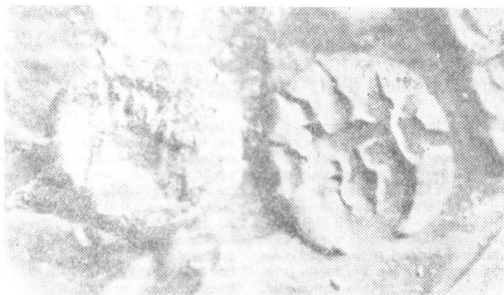
Fig. 2. Moneda de la Oarța de Sus. Contramărcile.

Pe revers este reprezentată emblema oraşului Histria, vulturul cu aripile deschise, pedelfin, spre st. În faţa vulturului — un spic de grâu, vertical. Din legendă se văd numai I[Σ]TPI[H]. În cimp apar literele XA, probabil numele unui magistrat monetar.