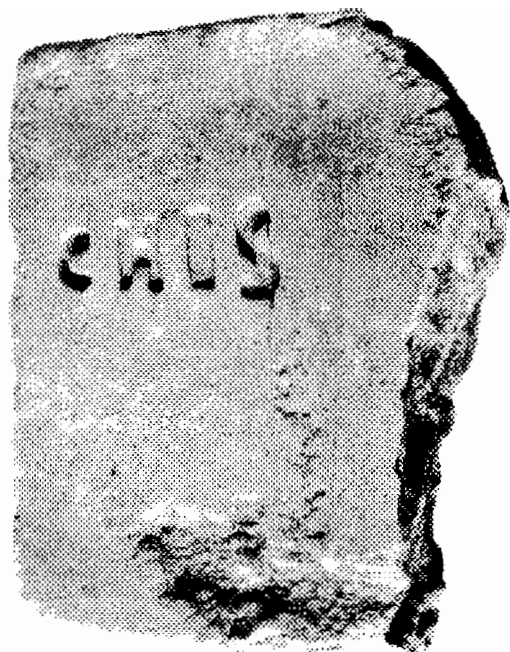
Fig. 1-3. Ștampilă pe cărămidă, din castrul de la Dăești-Sânbotin ( Castra Traiana ), jud. Vâlcea (1-2 foto I. Osmulikevici; 3 desen O. Enache).

praesidio ”), iar un alt detașament e semnalat la Buridava („ Buridavae in vexillatione ”) 6 . Existența acestei vexilații poate fi corelată cu descoperirea, la Arutela (Bivolari, jud. Olt), a unei plăcuțe de argint, ruptă în trei bucăți și având scrisul punctat, care vorbește despre Valerius Valerianus, eq(ues) lib(rarius) c(o)hor(tis) I His(panorum) 7 , precum și cu unele descoperiri de materiale tegulare la Angustia (Brețcu, jud. Covasna) 8 .