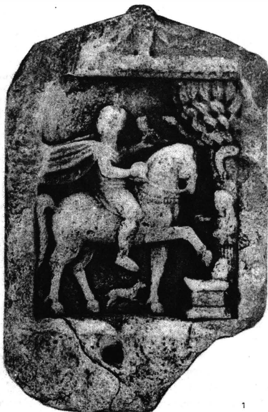
Fig. 1. Histria. Relief votiv reprezentând Cavalerul trac.

În dreapta altarului, personaj feminin stând în picioare, în profil spre stânga, păr lung pe spate, chiton lung strâns la mijloc, drapat, mâna stângă îndoită lateral cu palma în sus ține un obiect mic. Mâna dreaptă întinsă în față, cu palma semideschisă în jos.