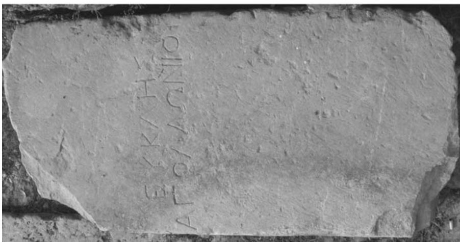
Fig. 1. Histria. Stela funerară elenistică