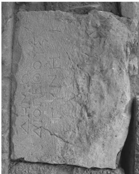
Fig. 3. Histria. Inscripția ISM I 250 încastrată în zidul nordic al podiumului bazilicii.