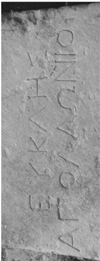
Fig. 2. Histria. Inscripția de pe stela funerară elenistică. Detaliu.